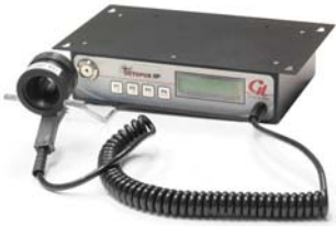
Boîtier robuste, façade intégrée