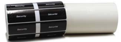
Sceaux de sécurité réguliers